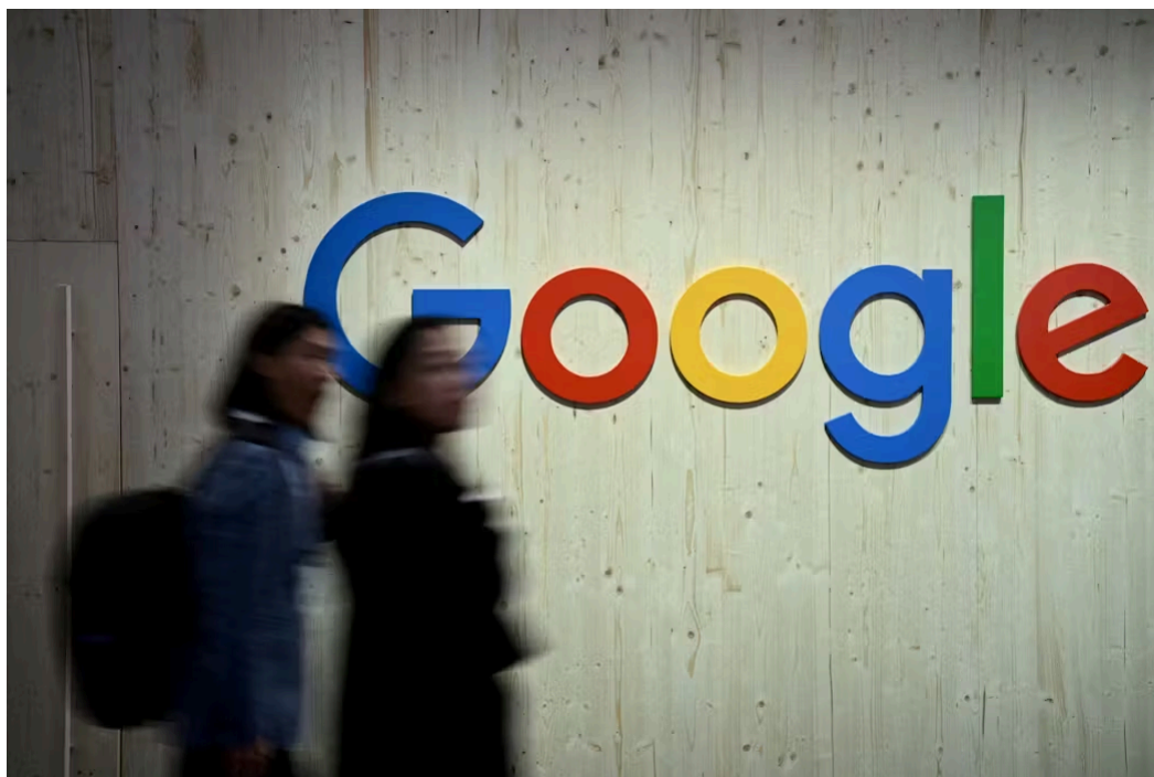
米グーグルは写真管理サービスで多様な人種への目配りが欠けていた

例えばSNS運営の場合、サービスの利用率を上げることばかり考え、気がつけば子供のメンタルヘルスを損なう事態を招いているといった具合だ。「多様な視点があれば新たな問題を事前に発見できる可能性が高まる」